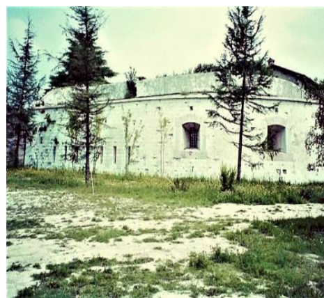
Forte Nugent a Pastrengo