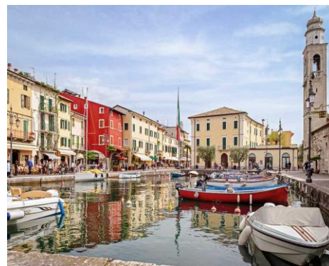
Panoramica di Lazise

Caffè con correzione, acqua liscia e gassata, vino (1 bottiglia ogni 3 persone)