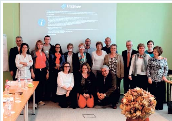
Meeting trasnazionale di Lubljana Maggio 2012