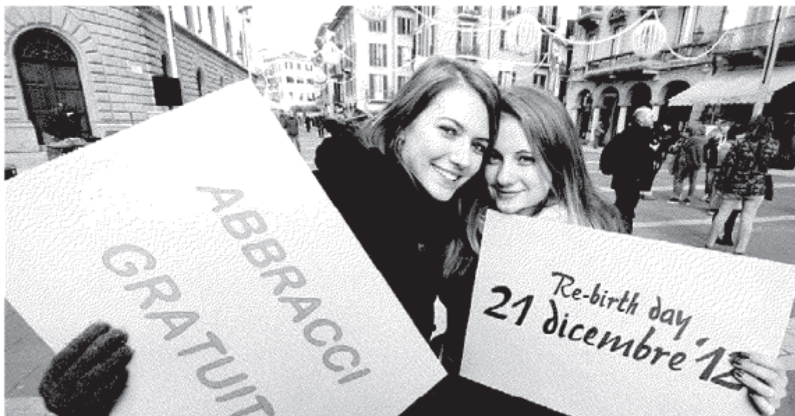
Cinquecento ragazzi si sono dati appuntamento in piazza ieri per il "Re-birth-day", tra abbracci collettivi, mani dipinte con i colori classici della tavolozza dal giallo al verde, e tanta musica. La creatività del liceo artistico contro la profezia catastrofica dei Maya. SERVIZIO A PAGINA 21

Lecco. "Il giorno della rinascita", la città si riempie di colori e allegria