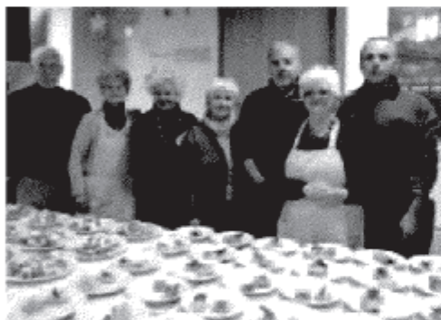
TANTI AUGURI I volontari che hanno cucinato e servito ai tavoli e alcuni momenti della cena targata Auser alla Casa sul Pozzo.