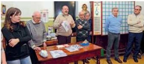
I responsabili dell'Auser, del Comune e di Linea dell'Arco alla tombolata alla Casa Anziani.

È stata pronunciata dall'amministratore bellanese venerdì scorso. Si può dire che il Centro di aggregazione della Casa Anziani abbia cominciato alla vigilia dell'Immacolata la sua nuova era. Con la presentazione ufficiale di venerdì, la struttura