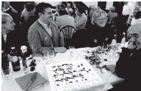
Un momento della festa dell'Auser che opera nel Meratese

La giornata è quindi finita in bellezza con una simpatica lotteria. ■ F. Alf.