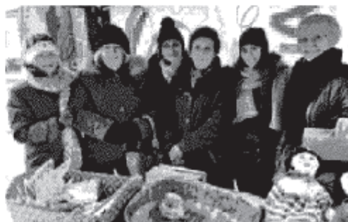
VOLONTARI MOBILITATI Tra gli stand allestiti per l'8 dicembre a Olginate quelli di Protezione civile, penne nere e Auser.