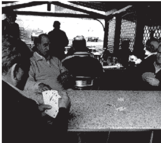
Soppiantata la tradizionale briscola dei circoli

trovano senza i soldi per pagare l'affitto e le bollette - prosegue Vertemati - . Da parte nostra stiamo organizzando dei convegni sul territorio per far comprendere le conseguenze negative del gioco esagerato. Facciamo prevenzione puntando soprattutto sul fatto che non si risolvono i problemi stando tutto il giorno nelle sale gioco». ■ P. San.