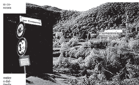
estire o dal- 0mila