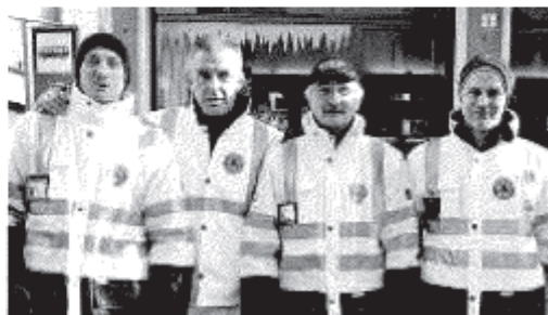
IN PIAZZA Volontari protagonisti del mercatino di Natale della Pro Loco: in alto i soci dell'Auser, gli alpini e la Protezione civile