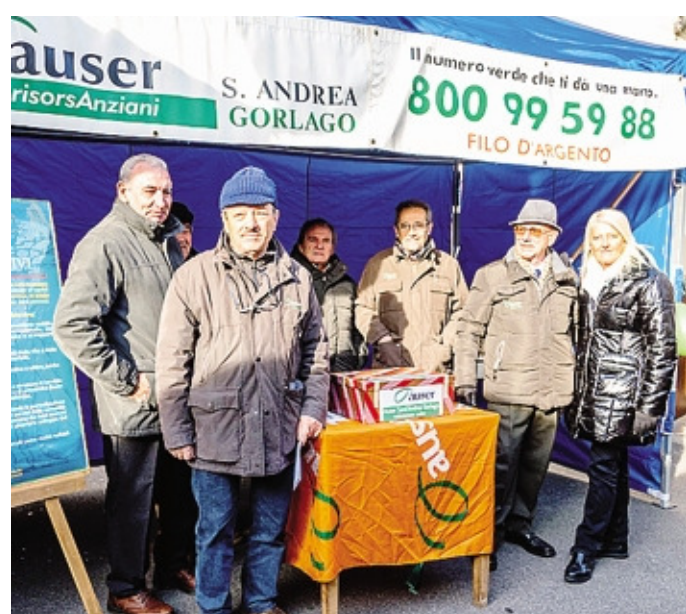
I volontari dell'Auser ieri alla festa