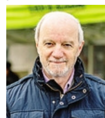
Gianluigi Marcassoli sindaco di Gorlago