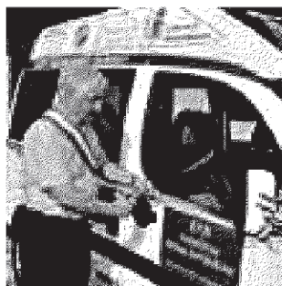
La nuova auto donata all'Auser Il momento della consegna