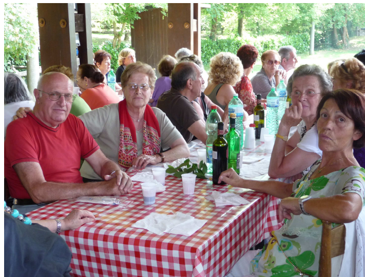
Un momento della festa presso il parco ROCCOLO