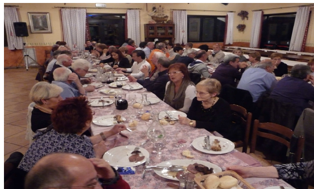
Due momenti della serata del 6 maggio

Giovedì 6 maggio presso l'agriturismo 4 Roveri gli amici del boogie-woogie si sono trovati a conclusione del corso iniziato l'autunno scorso. Si sapeva che la serata rientrava fra quelle che lasciano un segno ai partecipanti. Vero è che ai 40 ballerini si sono aggiunti altre 21 persone portando i commensali a 61 partecipanti. L'allegria non tardò a farsi sentire fin dai primi momenti. I partecipanti molto sereni e tranquilli hanno aspettato le prime note di Ivan abbandonandosi poi senza risparmio al ballo. Durante un piccolo intervallo alcune persone si sono messe a cantare. Segno evidente di una voglia di allegria. La spensieratezza accompagnò l'intera serata che non si è conclusa tanto presto. Felici e contenti fra ballerini e partecipanti l'incontro passa nella storia dell'associazione come momento indimenticabile.