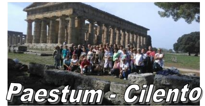
Paestum - Cilento

CAPODANNO nel PICENO ★ ★ ★ ★ CAPODANNO nel PICENO