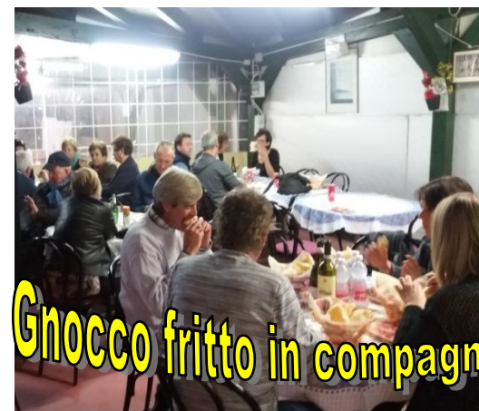
Gnocco fritto in compagnia

In quello spazio si sono svolte serate di musica, attività di intrattenimento, attività culturali. Gli utenti hanno potuto trascorrere momenti in compagnia e in allegria.