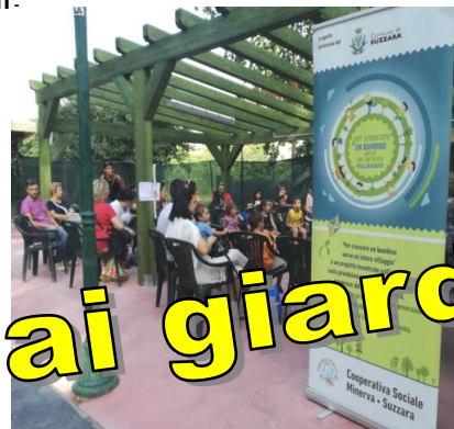
Favole ai giardini