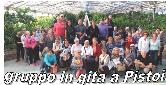
gruppo in gita a Pistoia

Buona riuscita delle varie iniziative. I nostri soci hanno dimostrato di gradire molto le settimane tour (Sicilia in primavera e Cilento in autunno) nei soggiorni di 15 gg la partecipazione è stata discreta, Anche i viaggi di un giorno a scopo principalmente culturale vedono sempre buona partecipazione (Cervia e le saline, mostra degli impressionisti a Treviso, Pistoia capitale italiana della cultura 2017) Questi ultimi, inoltre, ci danno la possibilità di metterci in contatto con sedi auser di altre zone in quanto ci rivolgiamo a loro per avere indicazioni e aiuti nell'organizzazione sul posto.