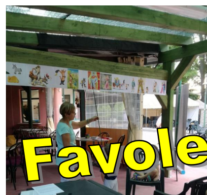
Favole ai giardini

La festa di autunno svoltasi l'8 ottobre che ha praticamente chiuso la stagione, ha visto la partecipazione di persone di tutte le età ed ha messo in opera una svariata gamma di attività: musica, giochi, baby dance, pittura per bambini, street art e, ovviamente, gnocco fritto e buoni salumi.