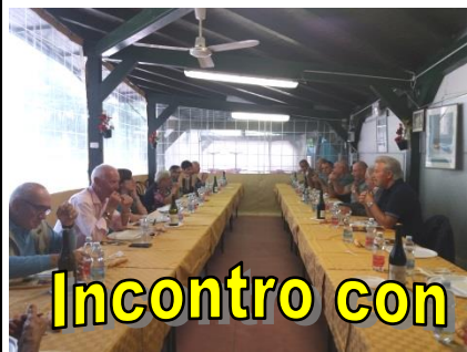
Incontro con i soci di Mosio