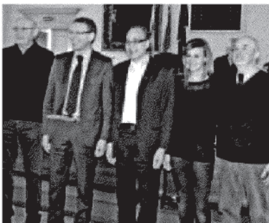
I PROTAGONISTI I nuovi regnanti e gli organizzatori.

XX Settembre fino al Municipio per la consegna delle chiavi della città per mano del sindaco di Lecco. Durante il Carnevale ci saranno poi la visita alle scuole materne della città, all'istituto Airoidi e Muzzi, la cena con i ragazzi diversamente abili presso il circolo Campaniletto di Pescarenico fino al momento clou della manifestazione: la sfilata di sabato 16 con partenza da piazza Cappuccini. Oltre 30 i partecipanti tra gruppi di ballo e carri non solo lecchesi, ma anche provenienti da altre province. Il costo complessivo dell'evento è stato di 30mila euro.