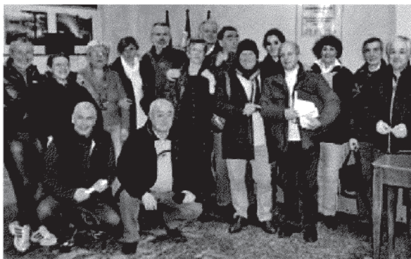
I protagonisti della prima assemblea congressuale dell'Auser Colico.

– rappresenta per noi un motivo di grande orgoglio, poiché è indice di un'attenzione e di una fattiva collaborazione per rispondere alle esigenze del nostro territorio sotto il profilo assistenziale e sociale». (s.p.)