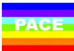
Tavola della Pace di Bergamo